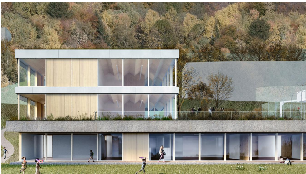
Rendering della vista sud del progetto 561.60 di Charles de Ry Architettura vincitore del concorso

Il concorso d'architettura con procedura libera ha una fase per la progettazione delle Nuove Scuole elementari e dell'infanzia di Vernate e Neggio che si è svolto tra settembre 2019 e marzo 2020, ha visto aggiudicare dalla giuria il primo premio agli autori del progetto 561.60 del team di progettazione composto dallo Studio di Architettura Charles de Ry Architettura di Lugano, dallo studio d'ingegneria civile Ruprecht Ingengneria SA di Lugano e dallo studio d'ingegneria RVCS Moggio Engineering SA di Bioggio.